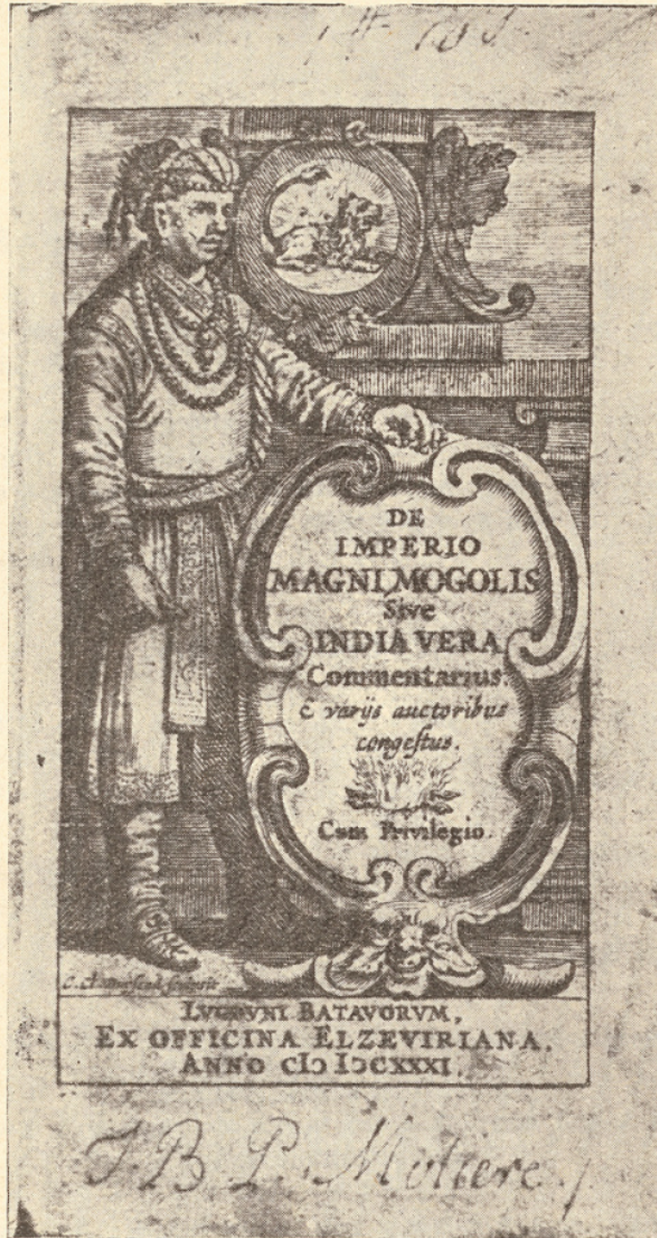
FIG. 2. — Signature autographe de Molière.