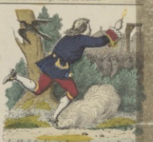
Le fils de l'auberge découvre le couvert volé par la pie à couvert Henriette est sauvée, son frère guéri et il épousa Henriette.

Fabrique d'Estampes de Grange, frères et P. Didot, à Metz. Déposé.