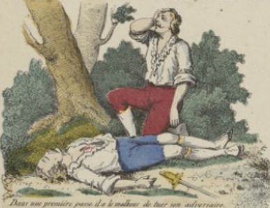
Dans son premier accès il a le malheur de tuer son adversaire.