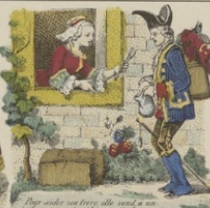
Pour aider son frère elle vend à un pauvre un couvert qui lui venait de sa mère.