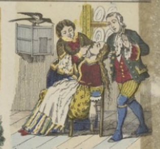
La maîtresse de l'auberge veut vendre la servante.