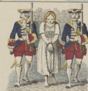
Henriette marche au supplice.