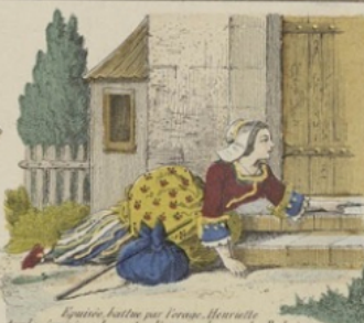
Après avoir par vengeance Henriette tombe épuisée à la porte d'une auberge de l'Alsace.