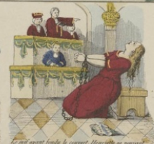
Le jail après l'ouïe le couvert, Henriette ne pouvant le reproduire est condamnée à mort.