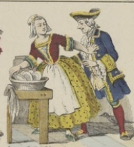
Le comte de Bléneau le jure à sa proposition.