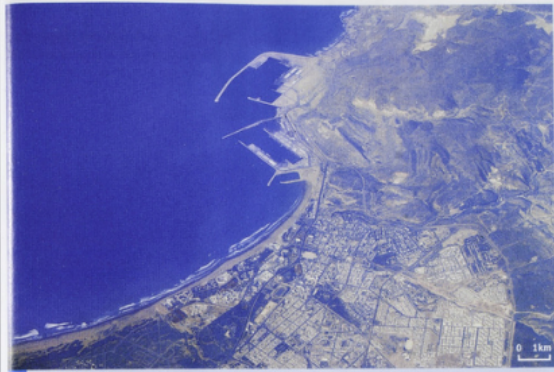
2 Agadir (Maroc).