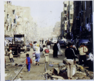
4 Le Caire (Égypte).