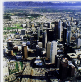
3 Los Angeles (États-Unis).