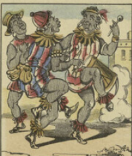
Les négres, après s'être reconfortés par un excellent repas, dansèrent une farandole de leur pays.