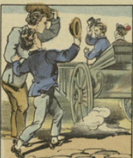
L'enfant devint ensuite un grand personnage et mérita le titre de Bienfaiteur de l'humanité.

OFFERT PAR THE SPORT 17 BOULEVARD MONTMARTRE PARIS