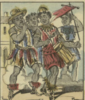
Trois mois après, des esclaves négres arrivèrent, musique en tête, chez les parents du petit garçon.