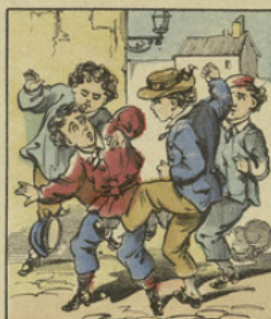
En sortant, ses camarades mécontents d'être frustrés, tombèrent sur lui à bras raccourcis et le battirent.