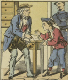
Le vieillard, pour récompenser le petit garçon, lui donna un billet de loterie des mines de Madagascar.