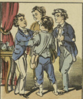
Puis il distribua à ses camarades pauvres, assez d'or pour subvenir aux besoins de leurs familles.