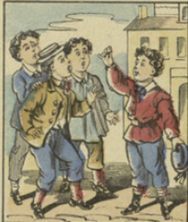
Un jour Paul en jouant aux billes trouva une pièce d'or trouée et s'empressa de la montrer à ses camarades.