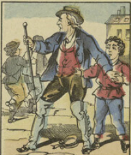
Un pauvre vieil homme qui passait par là, arracha Paul des mains de ses méchants camarades.