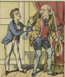
Le petit garçon donna une de ses plus belles propriétés à son bienfaiteur ainsi qu'une grosse somme d'argent.