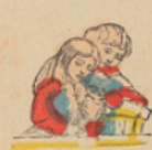
Zeebellen maken. Faire des bulles de savon.