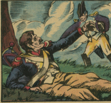
Il était présent partout, n'hésitait pas à parcourir le champ de bataille, opérant souvent sur place. Les humbles auxquels il se dévoua sans cesse lui décernèrent ce beau titre : La providence du soldat...