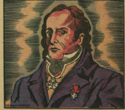
J. Dominique Larrey était professeur au Val-de-Grâce. Il fut de l'Académie d'Egypte et de l'Académie de Médecine dès leur fondation, membre de l'Académie des Sciences en 1829. Il fut surtout un être bon et humain, supérieurement dévoué, qui atténa tant qu'il le put les misères de la guerre.