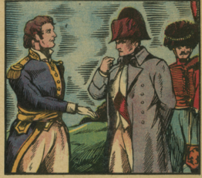
Il fut en Orient, de toutes les campagnes de la République et de l'Empire. Napoléon, qui s'y connaissait en hommes, ne l'appelait pas autrement que le vertueux Larrey. En Russie, il fut d'un zèle infatigable.