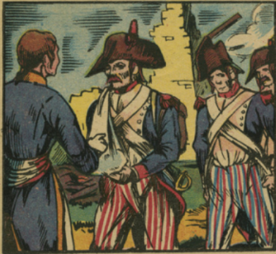
Larrey, chirurgien en chef de la Grande Armée, a été justement surnommé l'Amalroste Paré du XIX e siècle. Il débute à l'armée du Rhin en 1792, et crée les Ambulances volantes, qui permirent de donner des soins immédiats aux blessés.