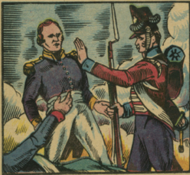
Il donnait l'exemple, était le premier à enlever les blessés sous le feu de l'ennemi. Il fut souvent blessé, notamment à Waterloo où les Anglais le firent prisonnier. Malgré son culte bien connu pour l'Empereur Louis XVIII le nomma chirurgien en chef de sa garde en 1818.