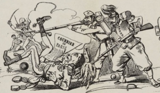
Sapristi...! Les journaux français sont bien informés; les nouvelles nous arrivent en même temps que les événements.