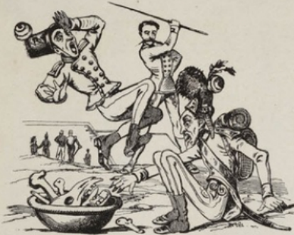
Au service de l'Autriche, le militaire n'est pas riche. Double ration de trique et d'un de cheval.