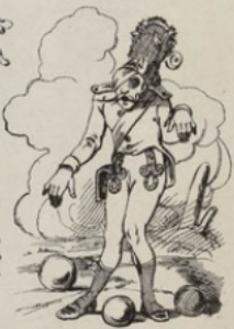
Frappé par les mitrs, battu par les Français, décidément j'ai pas de chance!