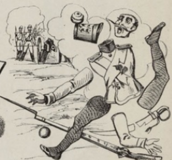
Effet produit sur les Autrichiens par les nouveaux canons rayés.