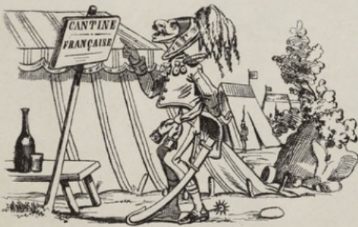
Les Français ont bien comu; ils refusent pas la bête à moi.