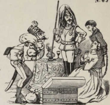
Nouveau moyen de battre monnaie employé par l'Empereur d'Autriche.