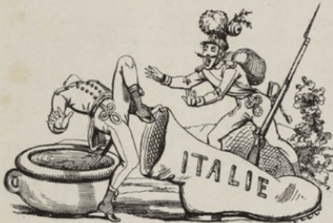
Quittons précipitamment sa botte, il tombe dans le Pô.