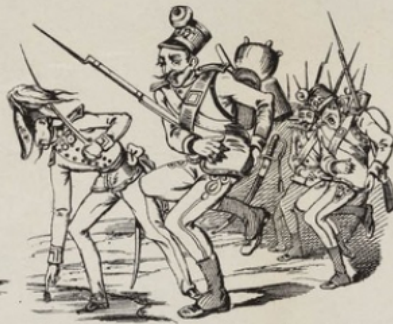
Peins d'enthousiasme, les Autrichiens se préparent à aller sur le Pô.