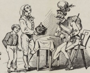
Oui M le sergent, vous allez boire un fameux bouillon.