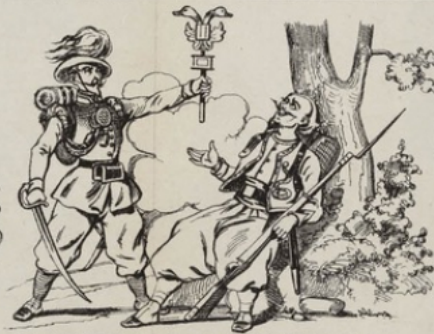
Voilà ma chamo, camarade! Ah! ma foi, ils ressemblent à deux canards.