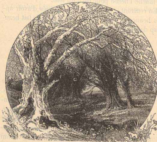
Ruisseau dans le bois.

Arrivés au bout de la plaine, nous commencerons à descendre vers la rivière. Le terrain est en pente de chaque côté de l'eau. Ce terrain en pente douce, au fond duquel coule un ruisseau, une rivière, un fleuve, s'appelle val , vallon ou vallée .