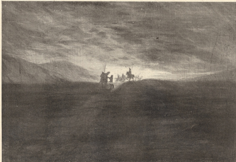
Le pontife maxime fit rechercher partout la Thaumaturge et ses compagnons.