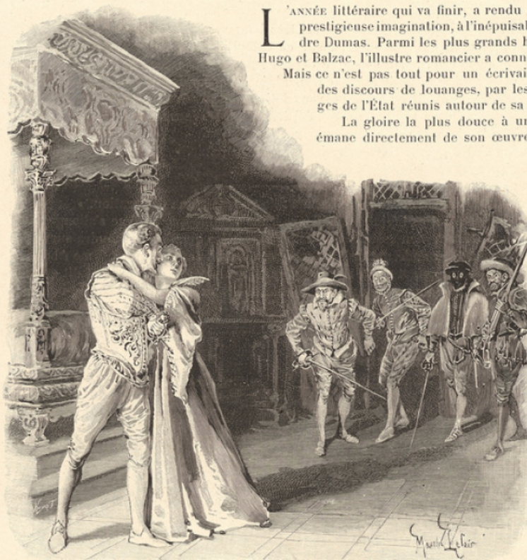
Gravure extraite de La Dame de Monsoreau .

Mais parmi tous ses romans lequel fallait-il choisir? Que d'œuvres magistrales pouvaient présenter de justes titres à une publication de ce genre!