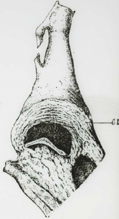
— Cuisse de vache.

BG, bride ou ligne grasseuse de la région crurale interne; GM, graisse mamelonnée.