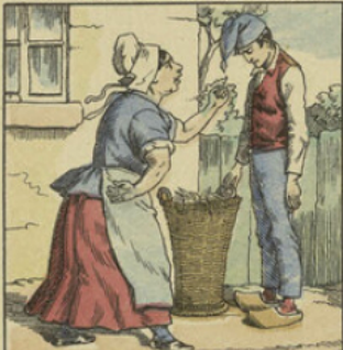
Quand Justin rentra, la méchante belle-mère, déjà prévenue de l'accident — il y a tant de bonnes âmes au monde ! — accueillit le malheureux l'injure à la bouche...