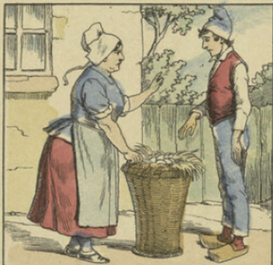
— Allons ! grand mollesse, faut pourtant voir à travailler quequ' peu !... tu vas porter ce panier d'œufs au Moulin-Joli, et, l'es prévins, autant d'œufs d'cassés, autant d'coups d'trique!