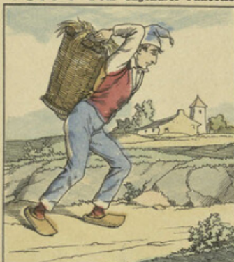
— Ah ! si défunt mon père me voyait tarabusté comme ça par c'te marâtre de belle-mère !... lui qui m'dorlotait !... que j'erois même qu'est ça qui l'a rendue si hargneuse !...