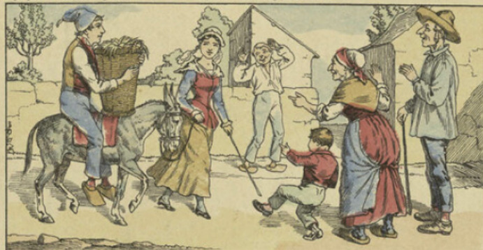
Mais alors, à la traversée du village, que de quolibets ! « En y'là s'un grand fanfanon, qu'a s'oublié ses éperons ! — A la chienlit, grand bêta ! » dit ! — Mais vous voyez ben qu'est deux hourrigues l'une portant l'autre, la plus grande sur la plus petite !... nique, nique ! — Moi, j'ais qu'est la p'tite meunière qui rapporte un futur et qu'y s'voit qu'elle l'a choisi bon pour être conduit... »