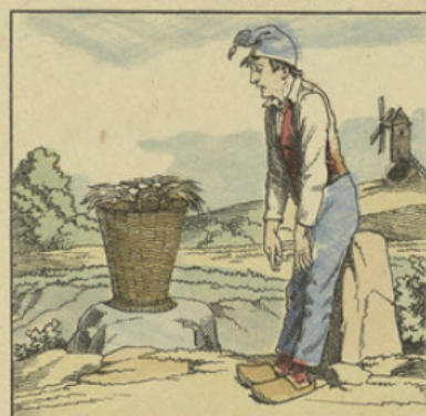
...Car, y a pas, elle a bel à dire mollesse, feignant, j'ais un peu châtif... j'ai grandi trop vite, ça se refers ; mais, en attendant, j'y arriverai jamais avec c'te charge, à c'moulin.