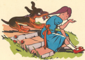
to bi ti re les nattes d'a li ne

nu no ni na né ne nu no nu na i rène - u ne é pine - u ne no te