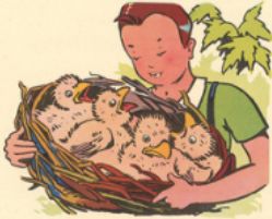
re né a re ti ré un nid

a li ne ta pe u ne à u ne les notes du pi a no - to bi é to nné ti re les na ttes d'a li ne - à la pé pi ni è re re né a re ti ré un nid de pie - pa pa i rri té a pu ni re né - re né ré pa re ra le nid à la nuit -