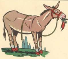
ca di est un â ne