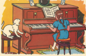
a li ne tape les notes du pi a no

nu no ni na né ne nu no nu na i rène - u ne é pine - u ne no te