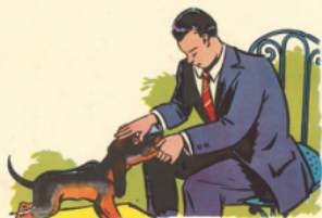
pa pa ta po te la tête de to bi

é é é è è è ê ê ê é è ê é pé e chè vre tête