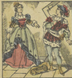
Puis il va à la chambre de Finette, et ne pouvant la décider à ouvrir, il enfonce la porte; mais la princesse armée d'un marteau le tint à distance.