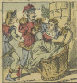
Riche-Cautéle voulant se venger, envoie sous les fenêtres de la tour des arbres chargés de fruits. — Finette pour contenter ses sœurs se fait descendre et est capturée par les officiers du prince.