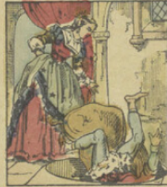
Le prince Riche-Cautéle tombe dans un piège dressé par Finette, et est précipité dans un égout.