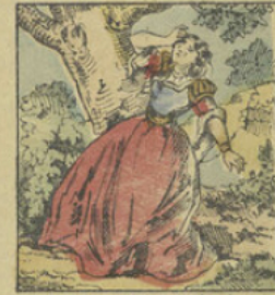
Celle-ci les emploie aux plus durs travaux; Nonchalante meurt de fatigue, et Babillarde s'étant enfuie se brise la tête contre un arbre.