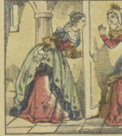
Finette va ensuite délivrer ses sœurs que le prince avait enfermées dans leur chambre.