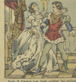
Puis il tourne son épée contre lui-même, mais Finette se précipitant sur lui, lui sauve la vie.

OFFERT PAR THE SPORT BOULEVARD MONTMARTRE PARIS