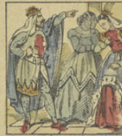
De retour de la guerre, le père des trois princesses demande à voir les quenouilles, et Finette ayant pu seule montrer la sienne, il envoie à la Go, Nonchalante et Babillarde.