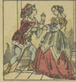
Les princesses s'étant enfuies dans leur chambre, Riche-Cautéle décide Nonchalante à lui donner sa foi, et l'ayant enfermée il en fait autant de Babillarde.