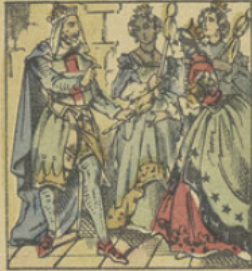
Un roi parlant pour la Palestine, enferme ses trois filles dans une tour, leur donnant à chacune une quenouille de verre qui devait se briser à leur première suite.