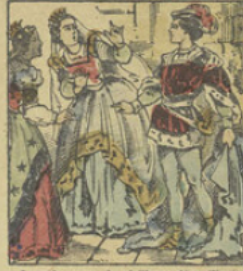
Le soir venu, la vieille se dépoilant de ses haillons, apparaît sous les habits d'un jeune prince; c'était Riche-Cautéle, fils d'un roi voisin.