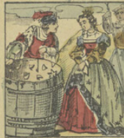
Finette est conduite sur le haut d'une montagne, où elle trouve le prince qui la menace de la faire mettre dans un tonneau hérissé de pointes acérées.