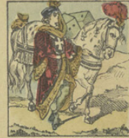
Les sœurs de Finette ayant eu deux fils, Finette les fait mettre dans des boîtes et se dirige vers le royaume de Moult-Benja, déguisée en médecin.