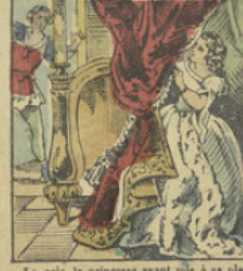
Le soir la princesse ayant mis à sa place un mannequin dans le lit, se cache dans un coin à l'arrivée de Bel-à-Voir.