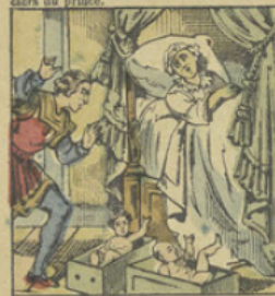
Elle se fait conduire près du malade, et ayant dit qu'elle allait quêrer une eau incomparable, elle laisse les boîtes où l'on trouve les deux enfants.