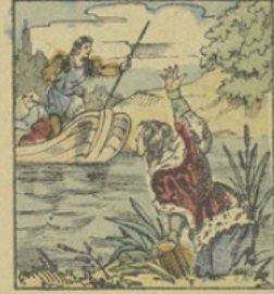
Riche-Cautéle parvenu à sortir de l'égout qui donnait sur une rivière, se fait entendre à des bateliers qui pêchaient.