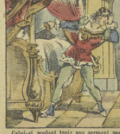
Celui-ci voulant tenir son serment pose son épée au travers du mannequin qu'il prend pour Finette.