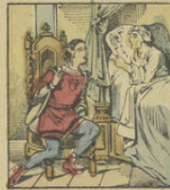
Riche-Cautéle incourant, fait promettre à son frère Bel-à-Voir, d'épouser Finette et de lui plonger un poignard dans le cœur.