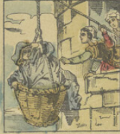
Les filles du roi, Babillarde et Nonchalante, montent dans le corbillon qui servait aux provisions, une vieille femme qui demandait la charité.