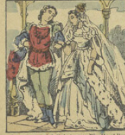
Le prince Bel-à-Voir épouse Finette et l'on fait des fêtes magnifiques en l'honneur de ce mariage.