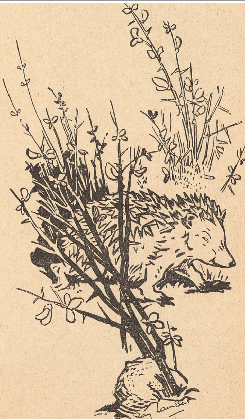
Sagesse-des-Buissons sortit d'une touffe d'ajoncs.