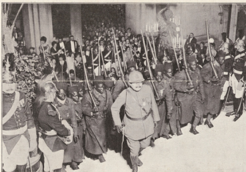
Les héros de l'Armée noire.