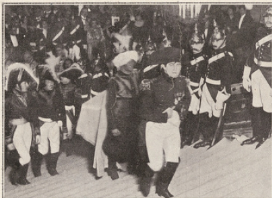
Napoléon et son fidèle Mameluk.