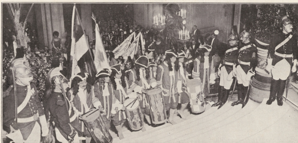
Les tambours des Gardes françaises.

Les bénéfices de cette fête ont été distribués à la Caisse de Prévoyance de la Maison des Journalistes, à la Fondation de la Victoire, à l'Aide des veuves de militaires et à l'Association des mutilés de la guerre.