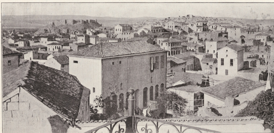
Vue générale d'Ain Tab (ville de 70.000 habitants, située à 120 km au nord d'Alep). Les opérations autour d'Ain Tab duraient depuis Février 1920. La ville a été enlevée aux Turcs le 9 Février par les troupes du colonel Andrea.

A l'occasion de la prise d'Ain Tab, le général Gouraud a bien voulu adresser au Monde Illustré , qui en est particulièrement honoré, la déclaration que nous reproduisons ci-dessus.