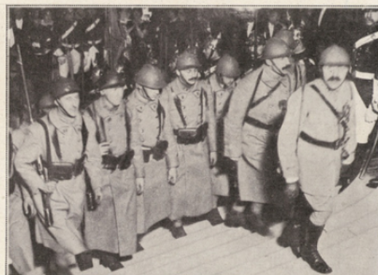
Les soldats de la grande Guerre.