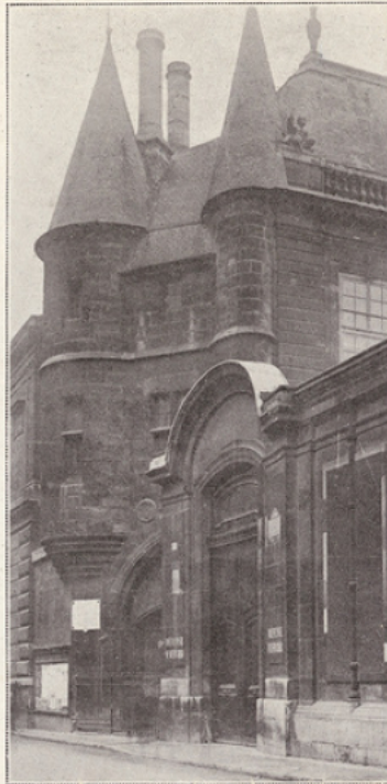
L'entrée du Palais Soubise, première Ecole des Chartes.

Facsimile d'un extrait du « Serment de Strasbourg », premier monument de la littérature française (842).