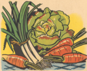
des lé gu mes