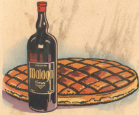
u ne ga let te