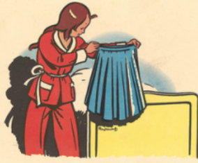
le py ja ma la ju pe