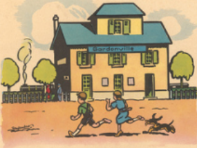
la ga re