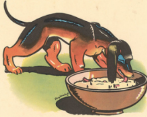
to bi vi de la ja tte