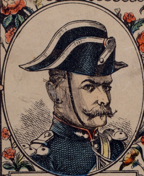
Voici le gendarme, le voleur n'est pas loin