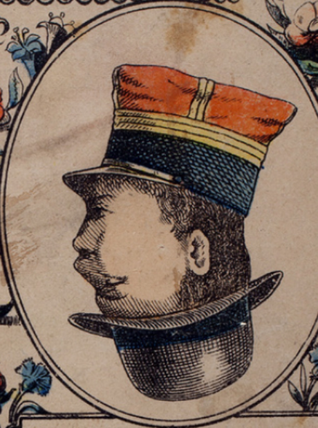
Deux Messieurs bien coiffés