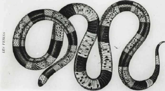
— Elaps fulvius. (Méditerranéenne. Serpent venimeux.) (D'après L. Stejneger.)