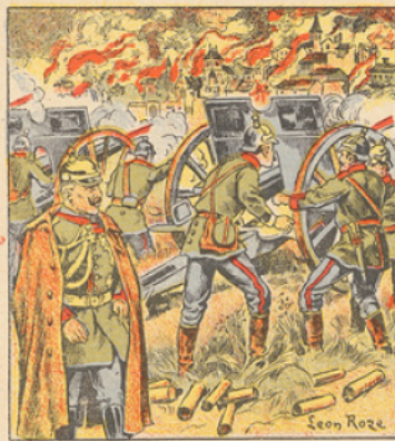
La ville de Louvain qui comptait 45.000 habitants et qui fut la métropole intellectuelle des Pays-Bas depuis le quinzième siècle, n'est plus aujourd'hui qu'un monceau de cendres. Les Allemands, le 20 Août, venaient d'éprouver un échec et se repliaient en détordre sur Louvain. Leurs soldats, qui gardaient la ville, les accueillirent, par suite d'une erreur, à coups de fusil. Ils prétendirent alors que les coups de feu avaient été tirés par les habitants et, sans écouter leurs protestations, ils décidèrent de détruire la ville. Plusieurs notables furent fusillés et, quelques heures plus tard les soldats, à l'aide de grenades incendiaires mettaient le feu à Louvain.