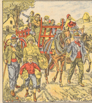
Les populations Belges chassées de leur sol par la horde barbare, s'enfuient éperdues vers la France, où elles viennent chercher un abri. Dans la journée du 25 Août quinze cents de ces malheureux, dont quatre cents enfants en bas âge arrivent à Paris dans des trains spéciaux. L'accueil de ces familles trainées derrière elles les quelques objets indispensables qu'elles ont pu sauver dans leur fuite précipitée, est vraiment lamentable. Hommes, femmes, vieillards, enfants, traversent les rues de Paris sous les regards épirotyés des passants. Tous ces malheureux sont envoyés dans le centre de la France où ils aideront nos cultivateurs à faire leurs moissons.