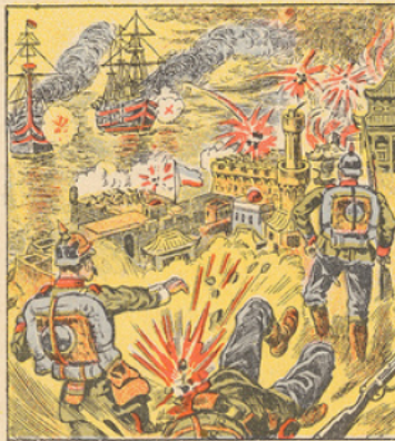
En raison des traités d'alliance qui l'attachent à l'Angleterre, le Japon a déclaré la guerre à l'Allemagne le 23 Août. La déclaration de guerre avait été précédée par l'envoi, le 20 Août, d'un ultimatum au gouvernement allemand, le sommant de retirer ses deux escadres et d'évacuer le territoire du protectorat de Kiau Tchou. L'Allemagne n'ayant pas répondu à cet ultimatum, une escadre japonaise a bombarde le 24 Août le bombardement de Tsing-Tao qui défend l'entrée de la baie de Kiau Tchou.