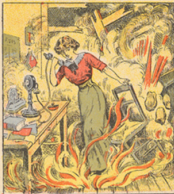
La petite ville d'Etain était bombardée le mardi 25 Août à six heures du matin. Le bureau de poste était assailli à la garde d'une jeune employée qui stoïquement était devenue à son poste. Pendant que les obus pleuvaient sur la ville, elle téléphonait à Verdun pour faire compie de ce qui se passait. Le directeur des postes de Verdun était en train d'écrire cette courageuse jeune fille lorsque, tout à coup, celle-ci s'interrompit et cria : « Une bombe vient de tomber dans le bureau ». Et tout rentra dans le silence.

La téléphoniste d'Etain. Les cigognes en Provence. Bataille de Charleroi. - Les japonais bombardent Tsing-Tao. - Exode des populations Belges. - La marche des Russes Destruction de Louvain. - Constitution du ministère de défense nationale. - Le général Gallieni.