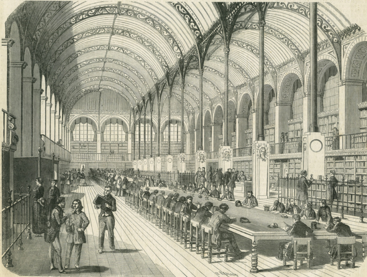
Nouvelle Bibliothèque Sainte-Genève. — Salle de lecture.

état, et, en es dérivant de quelques défauts, les eût mises en état de mieux répondre à leur propre objet. Une grande économie se fût trouvée réalisée, et les nombreux lecteurs qui fréquentent la bibliothèque Sainte-Genève n'eussent point eu à souffrir de la clôture nécessitée par le déplacement des livres. Deux objections étaient faites au projet d'une restauration. D'une part, on se plaignait que la bibliothèque fût enclavée dans les bâtiments du collège Henri IV; de l'autre, on arguait de quelques déviations dans l'équilibre général, pour suspecter la solidité de l'édifice. La première objection présentait seule quelque valeur. La seconde s'évanouit au contact de l'expérience. Lors du déplacement des livres, les plus fortes secousses furent imprimées aux galeries dans la direction de leur plus grand axe, c'est-à-dire dans les conditions les moins favorables pour le bâtiment. Rien ne bougea. Mais qu'importait l'éloquence de cette épreuve! La translation avait été décidée sur le rapport d'une commission, qui, selon la coutume, fit usage moins de ses yeux que de ses oreilles.