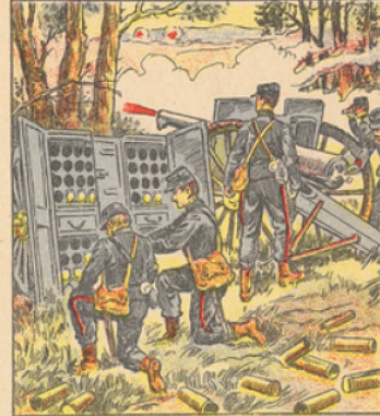
Notre merveilleux canon de 76 a rapidement acquis une célébrité mondiale. Les récits de témoins sont unanimes à proclamer sa supériorité sur la pièce allemande de 77 millimètres. Les ravages qu'il exerce chez l'ennemi sont effroyables et il a contribué d'une façon terrifiante, à assurer nos belles victoires. Des régiments entiers ont été anéantis par cet admirable engin. Partout où sa voix puissante se fait entendre, il sème la panique et la mort. Les allemands le redoutent avec raison. Nos canons de 76 leur inspirent une telle frayeur qu'ils les ont surnommés : « l'artillerie du diable ».