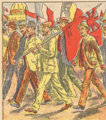
Le 31 Août était le premier jour où l'administration militaire avait décidé d'accepter les engagements volontaires d'étrangers désireux de prendre du service dans l'armée française. Dès huit heures du matin, ce jour là, plus de 4.000 volontaires Italiens, Russes, Luxembourgeois, Anglais, Américains, Tchèques, Serbes, etc., se pressaient avec leurs drapeaux sur l'esplanade des Invalides, attendant de passer l'examen médical. Cette manifestation montra que le monde entier n'a cessé de voir dans la France la grande libératrice et le champion désintéressé de l'humanité.

On peut voir maintenant dans la chambre mortuaire, les deux sœurs de Pie X et le cardinal Merry del Val priant auprès du cadavre.