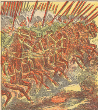
Au moment où Guillaume II avait lancé contre la France les hordes formidables qui s'élevaient sous ses ordres, et envahit Paris, la Russie sous la mobilisation est plus lente, réussissant par une habile tactique à faire déchoir le plan des barbares. Le 20 Août en effet, nos alliés pénétrèrent en Prusse orientale une pointe hardie obligeant le kaiser à distraire de ses armées opérant en France les forces indispensables pour barrer la route de Berlin. Le départ de ces troupes facilita nos premiers succès.