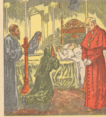
Le pape Pie X s'est éteint le 20 Août à 1 h 35 du matin. On peut dire qu'il est mort victime de la guerre. Avant que ne se produise la catastrophe il avait dicté les mêmes d'incompréhensibles épîtres pour éveiller les horreurs de la guerre. En apprenant les massacres commis en Belgique il ne put retenir ses larmes et il s'écria : « Ah ! ma malheureuse guerre abominable ! Elle me fera mourir ! »

Le général de Castelnau était en train de dicter des ordres quant un officier se présenta devant lui et lui fit connaître la mort de son fils. Le général eut une légère secousse, resta silencieux une seconde, puis allant rejoindre ses officiers il leur dit : « Continuoos marchons ». Quelques jours plus tard, le 9 Septembre, le fils aîné du général devait être, à son tour, tué à l'ennemi.