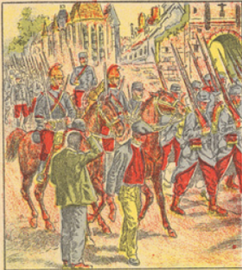
Tandis que les hordes allemandes envahissent la Belgique et se heurtent à la défense héroïque des Belges, nos armées de l'est combattent avec un entrain et une ardeur dignes d'admiration. En Alsace, notamment entre Mulhouse et Altkirch, nos soldats obtiennent de brillants succès. Les Boches subissent des pertes importantes et sont obligés de se replier.

Le 19 Août, les Français, dans un superbe élan, entrent à Mulhouse accueillis par les acclamations patriotiques des Alsaciens.