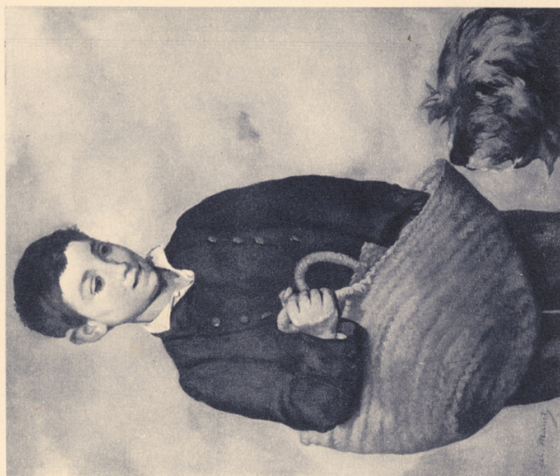
Pl. 12 - Edouard MANET (1832-1883) - L'enfant au chien