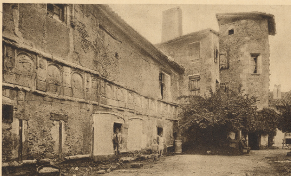
CHATEAU DE CASTELJALOUX (L.-et-G.). — Ce Château fut construit par la Maison d'Albret. Ce fut, en particulier, la résidence de Jeanne d'Albret, mère du roi Henri IV.