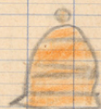
une hache. une cloche