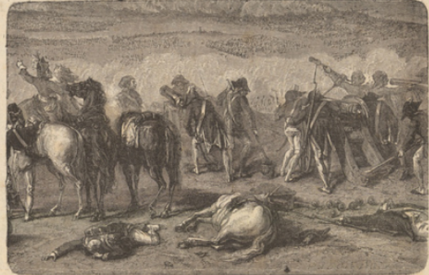
Bataille de Jemmapes.

Les Autrichiens, désespérant de prendre Lille d'assaut, couvrirent la ville de projectiles, bombes et boulets rouges qui portaient partout l'incendie et la dévastation; mais les habitants faisaient gaiement la chasse aux bombes, les saisissaient avec des pinces et les jetaient dans l'eau pour les empêcher d'exploder; un perquisiteur imagina de se faire un plat à l'harbe avec un éclat de bombe, et s'installa dans la rue; tous ses voisins voulurent se faire raser par lui, mais il n'en eurent pas le temps, parce que les Autrichiens décampèrent (6 octobre); ils n'avaient plus de bombes, ils avaient perdu 2000 hommes, et Dumouriez s'avançait pour les chasser.