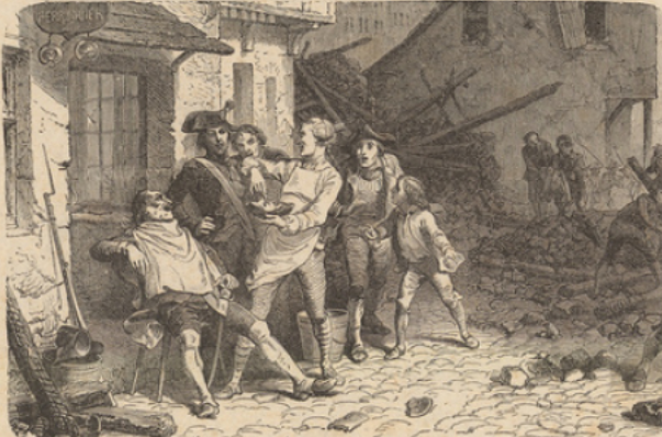
Bombardement de Lille.

mapes (1792), et conquiert la Belgique, pendant qu'une autre armée enlève au Piémont Nice et la Savoie. A la mort de Louis XVI, la coalition devient générale: seule contre l'Autriche, le Piémont, la Prusse, l'Allemagne, l'Angleterre, la Hollande, l'Espagne, le Portugal, Naples et Rome, la France est vaincue à Nerwinden, son territoire est envahi; en proie à la guerre étrangère et à la guerre civile, sa situation semble désespérée (août 1793), mais elle se relève par des prodiges d'énergie; Carnot organise de nouvelles armées, que commandent Jourdan, Hoche, Marceau, Kléber, Bonaparte; les Anglais sont vaincus à Hondschoote, et les Autrichiens à Wattignies (octobre 1793); le territoire est partout délivré, et les armées françaises franchissent à leur tour le Rhin, les Alpes et les Pyrénées.