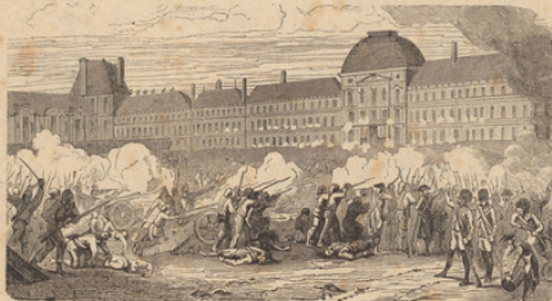
Journée du 10 Août.

M me Roland est une des femmes les plus célèbres de la Révolution. Quand son mari fut ministre en 1792, elle fit de son salon le centre du parti girondin. Condamnée à mort en 93, elle mourut avec courage, en disant : « O liberté, que de crimes on commet en ton nom ! »