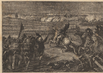
Bataille de Valmy.

La Fayette s'était rendu populaire pendant la guerre d'Amérique; il fut proclamé commandant de la garde nationale; mais, réduit à employer la force contre la multitude, il perdit toute popularité, et fut contraint de fuir.