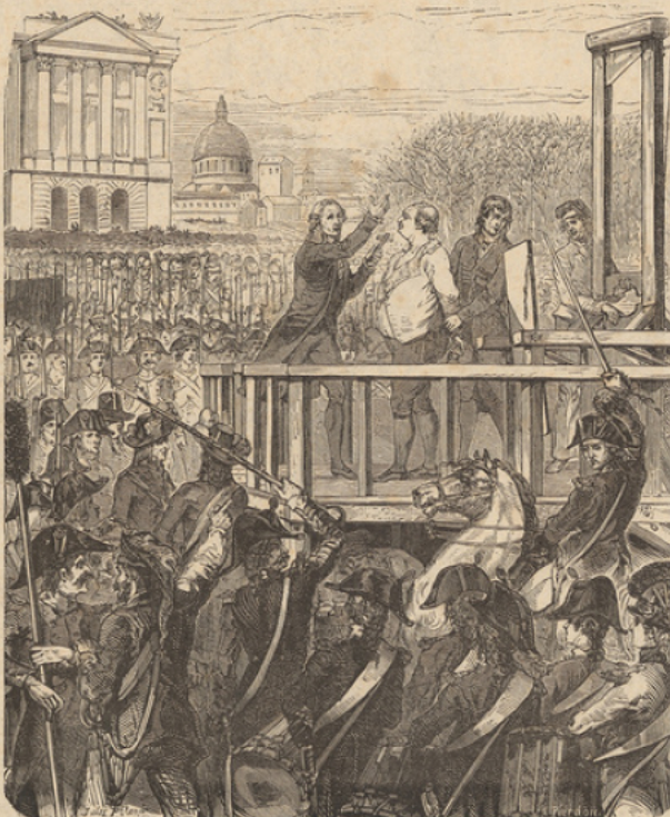
Exécution de Louis XVI.

La victoire de Valmy avait forcé les Prussiens à reculer; la victoire de Jemmapes arrêta les Autrichiens et donna la Belgique à la France; l'armée française, composée en grande partie de volontaires, était mal vêtue et mal équipée, mais elle était soutenue par l'enthousiasme et dansait la carmagnole jusque sous le feu du canon; elle s'élança en chantant à l'assaut des positions autrichiennes, et rien ne put l'arrêter (6 novembre 1792). Le lendemain Dumouriez faisait son entrée à Mons, et le 14 à Bruxelles. La Belgique, délivrée des Autrichiens, était pleine de joie de devenir française, et l'Europe était plongée dans l'étonnement.