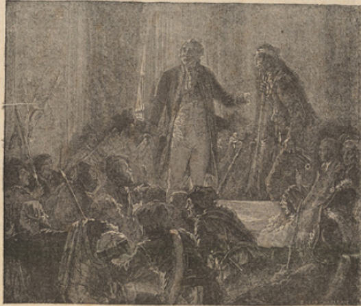
Journée du 20 Juin.

colère, s'empare des Tuileries (le 10 août 1792), et emprisonne le roi. L'assemblée est débordée, et le pouvoir passe à la commune, composée des meneurs du peuple; un d'eux, Danton, est ministre de la justice, et la populace déchaînée massacre des milliers de royalistes aux journées de septembre. En même temps la France est gravement menacée par la Prusse, l'Autriche et le Piémont : le duc de Brunswick prend Verdun et franchit l'Argonne, mais Dumouriez, après avoir discipliné les volontaires de son armée, repousse les Prussiens à Valmy (septembre 92).