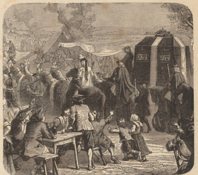
Enterrement de Louis XIV.

Fénelon avait été le précepteur du duc de Bourgogne, Louis, petit-fils de Louis XIV; c'était pour son élève qu'il avait composé le Télémaque . Nommé archevêque de Cambrai en 1695, il édifica tout le monde par sa douceur évangélique, par sa charité et par son infatigable dévouement: il visitait les malades, les pauvres, les malheureux; sa bonté lui faisait trouver des consolations pour toutes les misères. Pendant la guerre de la succession d'Espagne il fit de l'évêché une vaste ambulance, où il soigna lui-même les blessés.