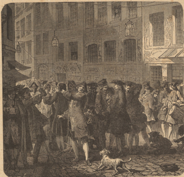
La rue Quincampoix, siège de la banque de Law.

Marie Leszcynska était fille de Stanislas Leszcynski, ancien roi de Pologne, qui vivait obscurément en Alsace. Mariée à Louis en 1725, elle fut très malheureuse.