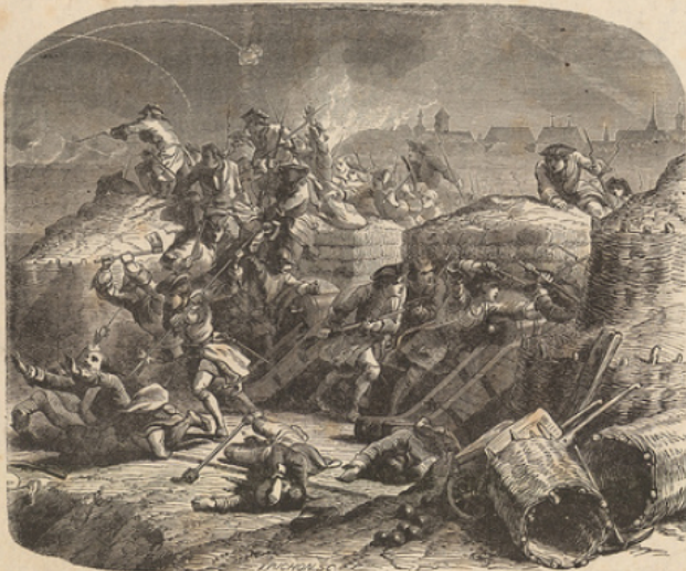
Défense de Lille par Boufflers.

glaises; enfin Villars remporte à Denain une éclatante victoire (1712). — L'Europe, lasse de guerre, se décide à diminuer ses exigences; les traités d'Utrecht (1713) et de Rastadt (1714) laissent l'Espagne au petit-fils de Louis XIV, mais donnent à l'Autriche la Belgique le Milanais et le royaume de Naples; la France cède à l'Angleterre Terre-Neuve et l'Acadie (Nouvelle-Écosse).