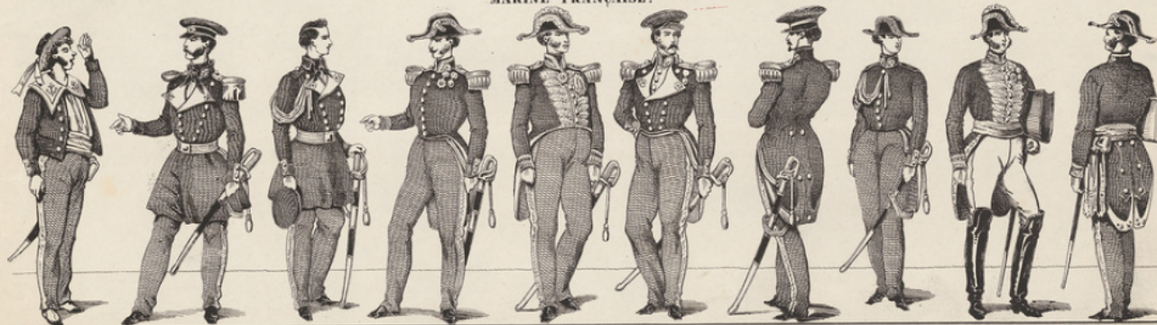
Matelot. Officier. Aspirant. Capitaine de Vaisseau. Amiral. Capitaine. Capitaine de Corvette. Elève. Intendant. Sous-Intendant. Propriété de l'Éditeur. Déposé.