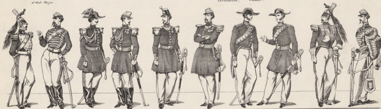
Colonel de Dragons. Off. Ch. d'Afrique. Aides de Camp. Capitaine. Chef de bataillon. Chirurgiens Majors. Cuirassier. Off. de Hussards. Chef d'escadron.