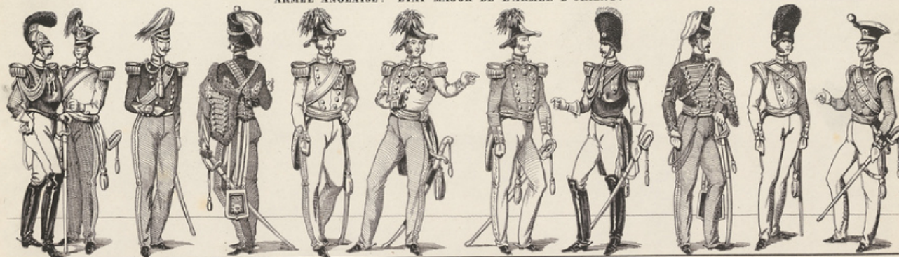
Officier des Mousquetaires. Off. du train d'artillerie. Off. de Chasseurs à cheval. Officier des Dragons légers. Généraux. Off. de la Garde royale à cheval. Off. de Hussards. Off. de Grenadiers. Off. d'Infanterie légère.