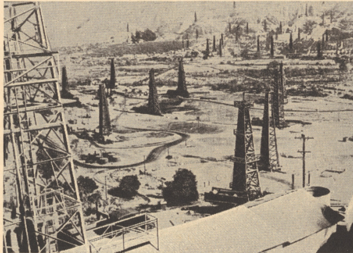
Vue d'un champ de pétrole.

Cependant, le pétrole lui-même est connu depuis la plus haute antiquité.