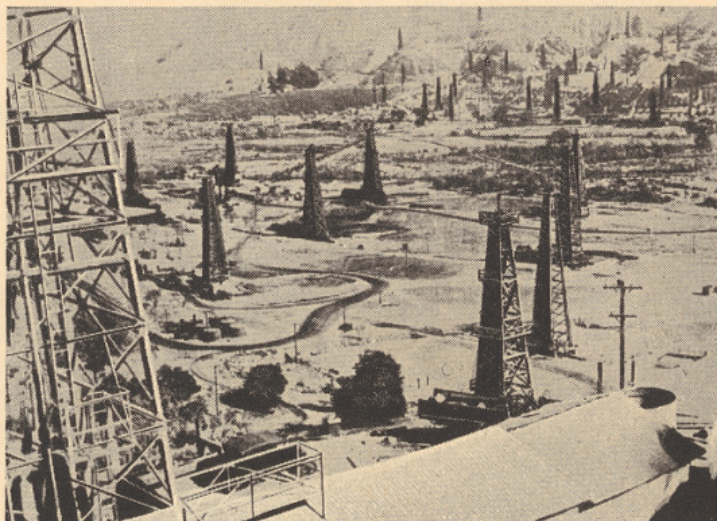
Vue d'un champ de pétrole.

Cependant, le pétrole lui-même est connu depuis la plus haute antiquité.