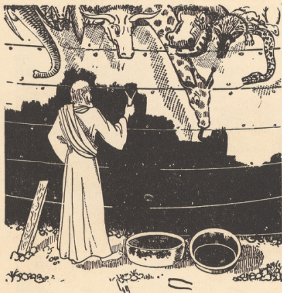
Noé calfatant son arche.

Les Peaux-Rouges, bien avant les premiers forages, utilisaient le pétrole qui affleurait à la surface du sol pour panser leurs blessures et soigner diverses maladies. Les Etats-Unis sont, en effet, et de beaucoup, le pays du monde qui renferme le plus de pétrole.