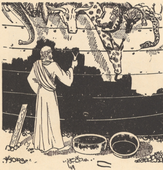
Noé calfaçant son arche.

Les Peaux-Rouges, bien avant les premiers forages, utilisaient le pétrole qui affleurait à la surface du sol pour panser leurs blessures et soigner diverses maladies. Les Etats-Unis sont, en effet, et de beaucoup, le pays du monde qui renferme le plus de pétrole.