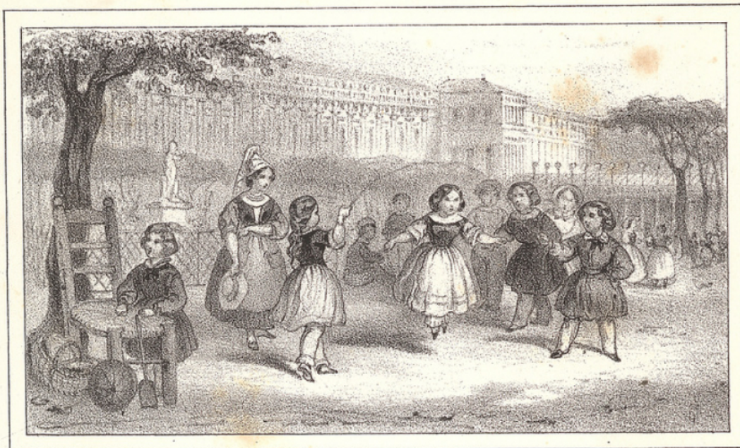
LE PALAIS NATIONAL Ancien Palais Royal.