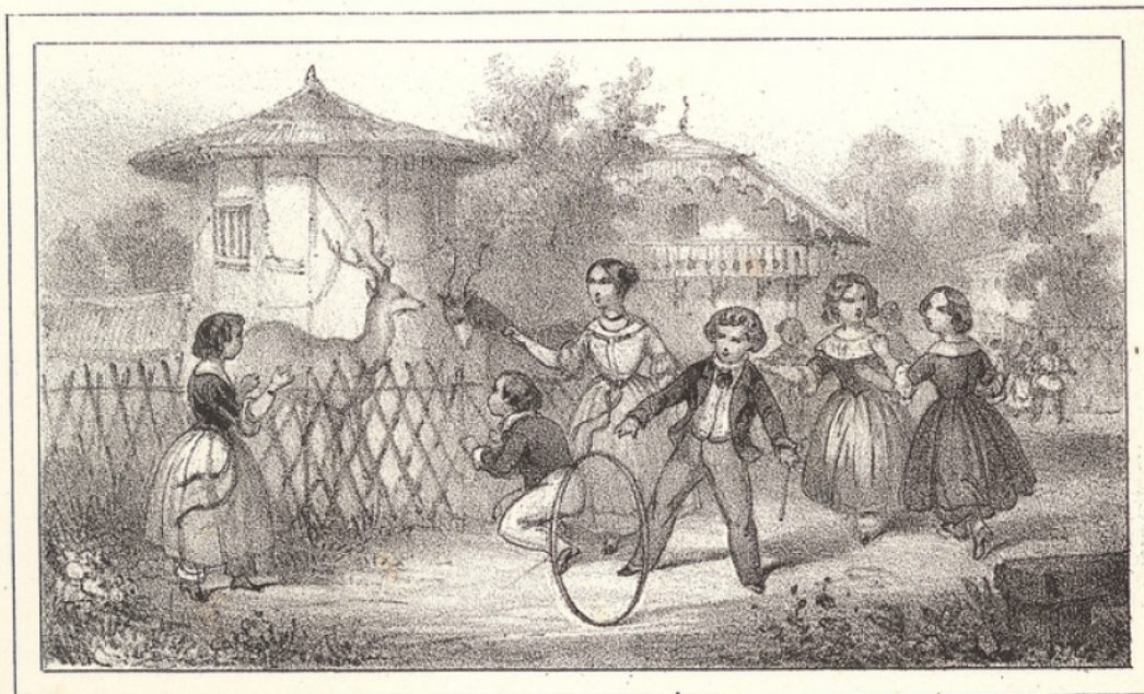
JARDIN DES PLANTES