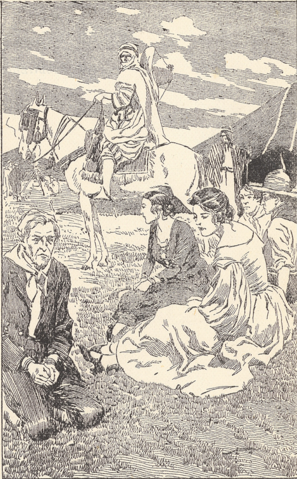
LES CAPTIFS SE REGARDAIENT MUETS ET DÉSESPÉRÉS