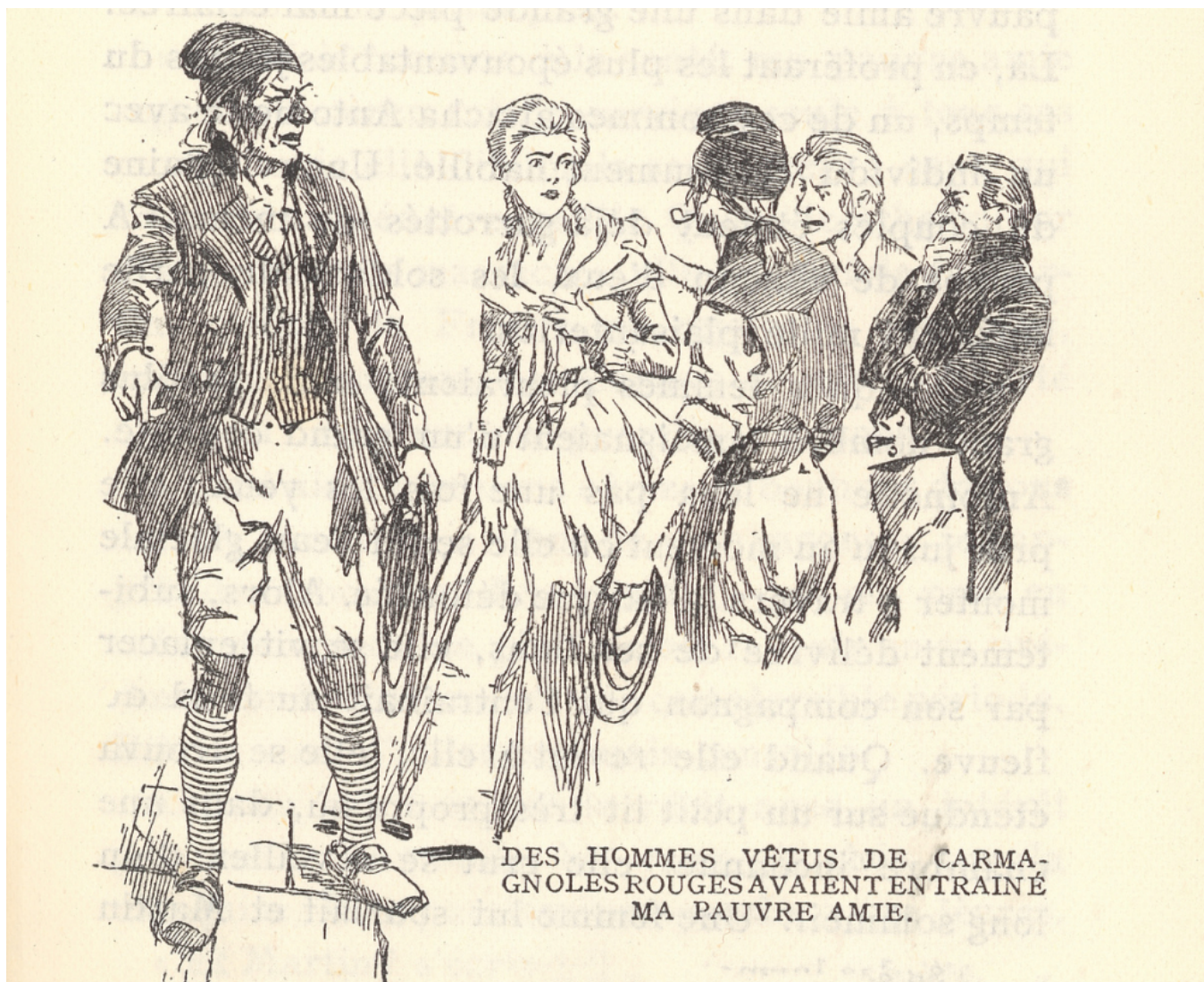
DES HOMMES VÊTUS DE CARMA- GNOLES ROUGES AVAIENT ENTRAINÉ MA PAUVRE AMIE.