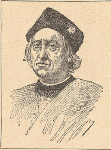
COLOMB ( Christophe ), navigateur génois. Entré au service de l'Espagne, il découvrit l'Amérique, et mourut à Séville. (1436-1506.)