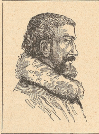
MAGELLAN, navigateur portugais; découvrit le détroit qui porte son nom. Il fut tué aux Philippines. (1470-1521.)