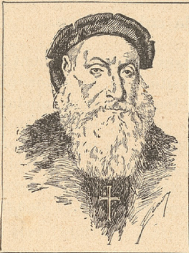
GAMA ( Vasco de ), navigateur portugais; découvrit la route des Indes par le cap de Bonne-Espérance. (1469-1524.)