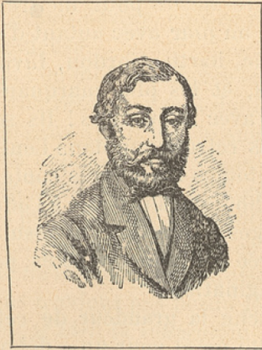
CAILLÉ ( René ), voyageur français; le premier Européen qui pénétra en Afrique jusqu'à Tombouctou. (1799-1838.)