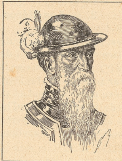
PIZARRE ( François ), aventurier espagnol qui conquiert le Pérou et fut tué à Cuzco par les partisans d'Almagro. (1475-1541.)