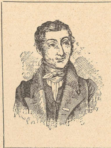
BARTH ( Henri ), explorateur de l'Afrique centrale; né à Hambourg. Il parcourut l'Égypte, l'Afrique, etc. (1821-1865.)