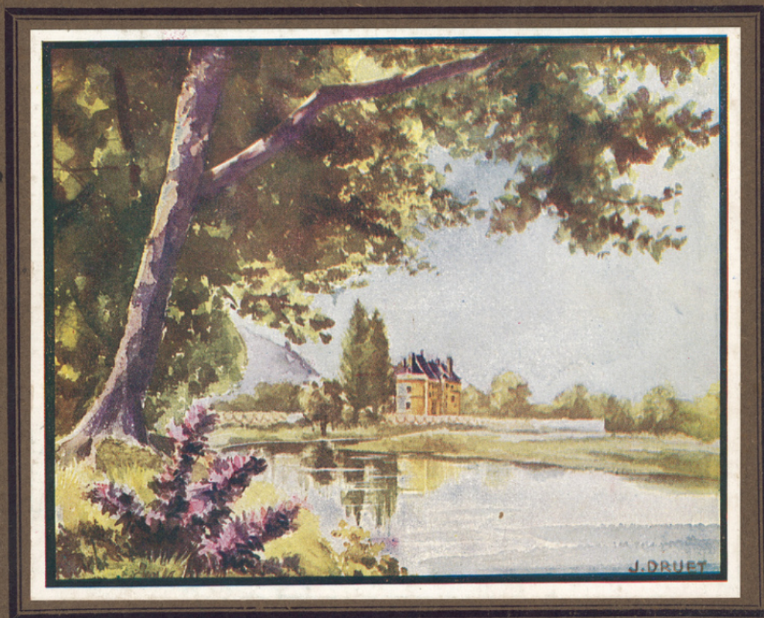
Le Loir et le Château du Lude.