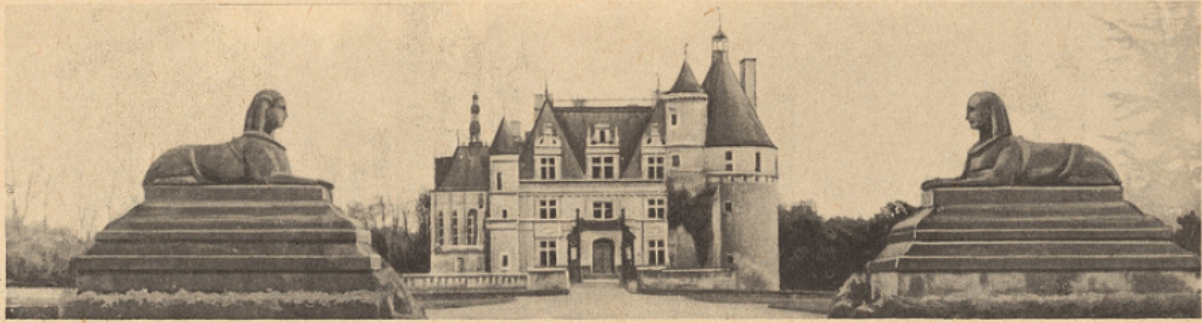
CHENONCEAUX — Style Renaissance — Entrée principale