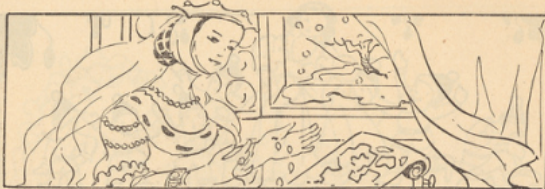
coloriez en rouge les gouttes de sang de la reine.