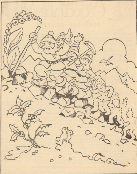
dessinez les petits nains et coloriez.