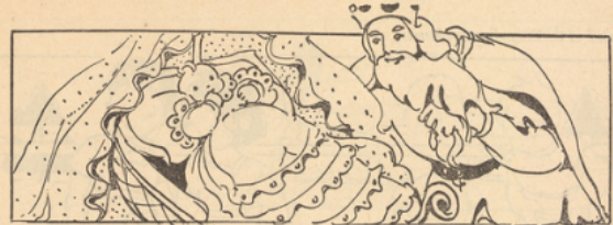
coloriez blanche-neige : (blanc, rose, rouge).