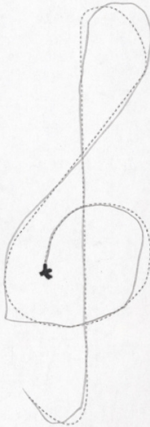
2 Repasse sur les pointillés en commençant sur la croix