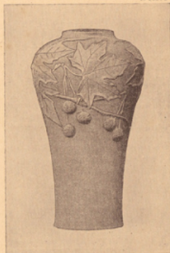
VASE MODÉLÉ ET DÉCORÉ, PAR DELAHERCHE, EN INTERPRÉTANT LA BRANCHE DE PLATANE.

DÉCORER, C'EST ORNER, EMBELLIR. Pour décorer, on s'inspire des formes naturelles, feuilles, fleurs, fruits, etc.; mais on les interprète différemment suivant la forme et la matière des objets.