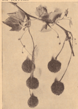
BRANCHE DE PLATANE PHOTOGRAPHIÉE D'APRÈS NATURE.