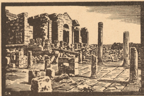
Ruines Romaines de Sbeitla (ancienne Sufétula)

Avec le rétablissement des villes, il fallut envisager leur assainissement et leur alimentation en eau potable, questions primordiales pour le développement et l'hygiène de toute agglomération.