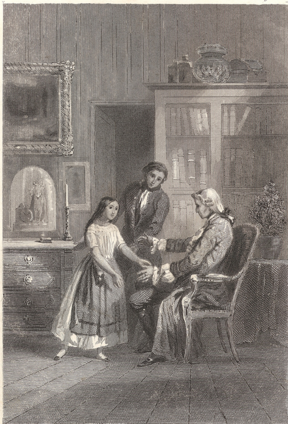
J. Noël del.