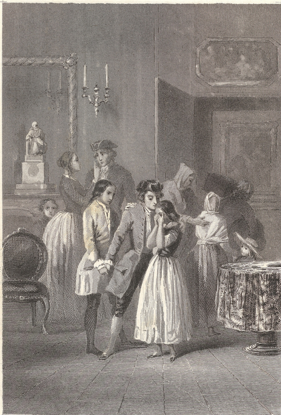
J. Noël del.