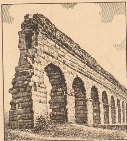
Ruines de l'Aqueduc Claudia à Rome

Les Romains avaient pour l'eau une véritable vénération. Leur premier soin quand ils créaient une ville, était d'abord d'en assurer l'alimentation en eau potable, dont ils étaient grandement dépendants.