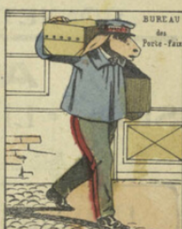
N'étant propre à rien, il s'en va chercher son pain ailleurs. Il fut enfin obligé de faire son métier de porteur-fais.