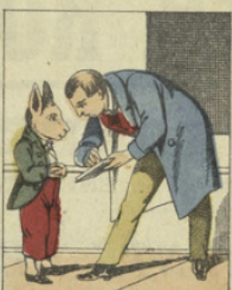
lui, le professeur lui explique que ce n'est pas LA qu'il faut écrire, mais le mot : CHEVAL.