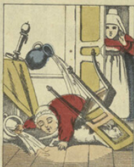
Ses cahiers n'offraient rien de remarquable, si ce n'est qu'il avait une agilité toute particulière pour renverser six objets à la fois.