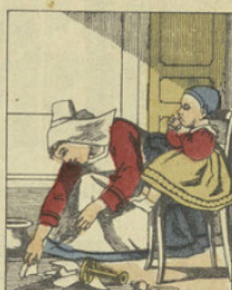
Une croûte de pain suffisait alors pour le calmer instantanément et l'assumer. Sa mère, lui trouvant un naturel sérieux et doux, rêvait d'en faire un notaire.