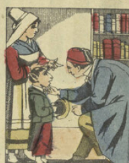
Elle le met en pension chez un professeur de la ville, où, ne lui trouvant pas des dispositions brillantes, promet cependant de faire son possible pour l'instruire.