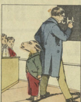
Il lui écrit le mot au tableau. Xavier, déjà impatient, fait une figure réellement bête, que toute la classe se met à rire.