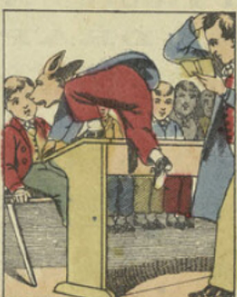
Xavier fait voir qu'il en connaît encore un autre: en sautant par-dessus la table.