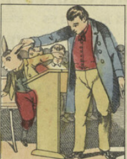
Le professeur perdant encore une fois patience, le fait sortir du banc et lui demande s'il ne connaît que ce chemin pour aller à sa place.