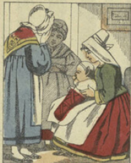
Le petit Xavier était, au dire des bonnes femmes, un étonnant petit enfant; on lui trouvait seulement les oreilles un peu longues.