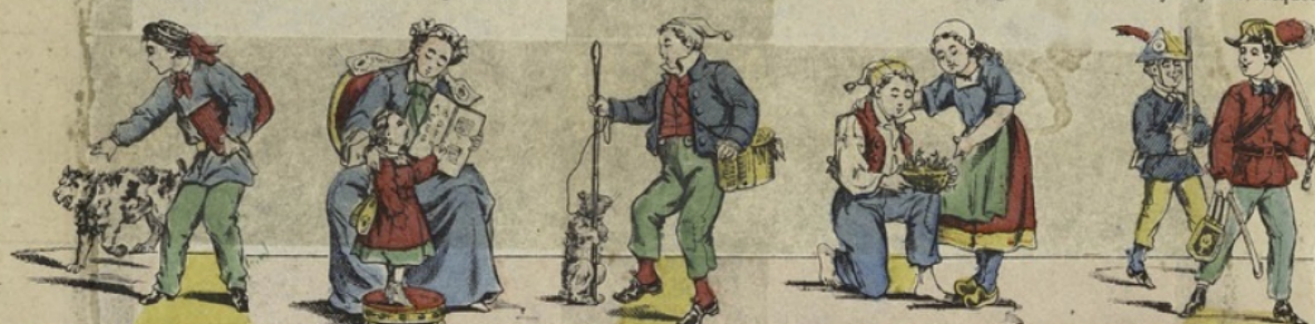
K Kiss, kiss, kiss? L La leçon. M Marmotte en vie! N Nid d'oiseaux. O Officier. En avant, marche!