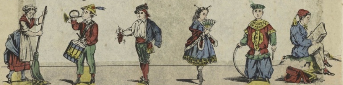
U Utilité. V Virtuose. X Xérésiens. Y Yakouikoui. (Déposé.) Z Zèle au travail.

Imagerie d'Epinal. — PELLERIN, imp.-édit.