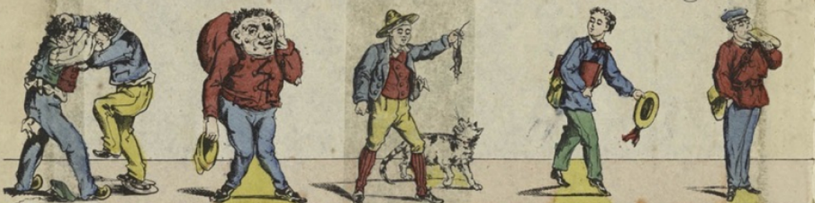
P Polissons. Q Quasimodo. R Rat. Psit! psit! psit! S Salutation. T Tartine.