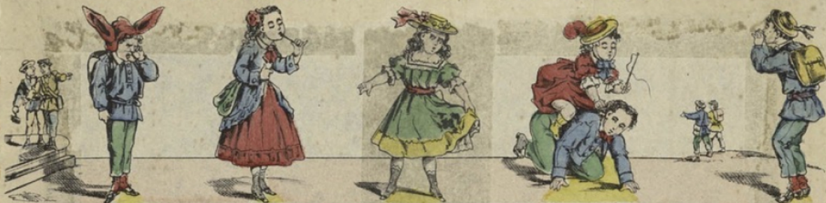
A Le bonnet d'âne. B Bonbon. Que c'est bon C Caca. Fi! caca. D Dada. Hu, dada. E Eh! les autres, ho hé.