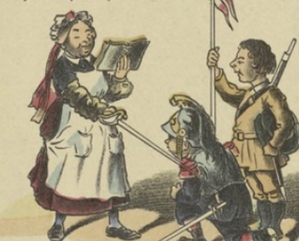
En tant que bardé de fer, et pour imiter Don Quichotte, objet de son admiration, Matapan estime qu'il doit, au préalable, se faire armer chevalier... Et Victoire, la cuisinière, ne sait lui rien refuser.