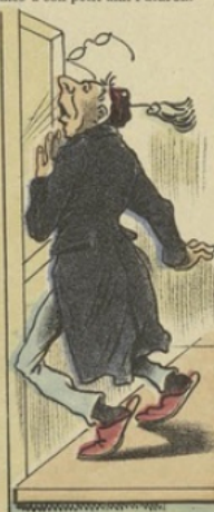
...au nez même de Monsieur le Maître!