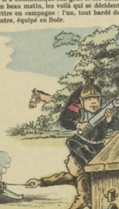
Puis, mis en goût par cette première manifestation, ils vont devant l'école proclamer leur indépendance...