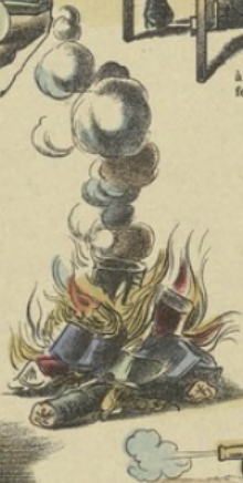
Mais, étant d'accord sur ce point que les coureurs d'aventures n'ont plus besoin de livres de classe, ils font des leurs un feu de joie.