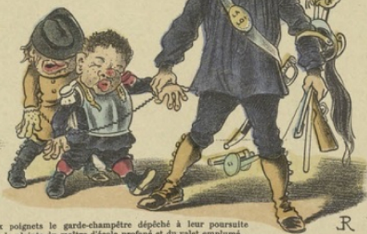
aux poignets le garde-champêtre dépêché à leur poursuite sur la plainte du maître d'école profané et du valet emplumé... Je m'étonne bien fort si, après cela, ils n'auront pas perdu à jamais le goût des aventures.