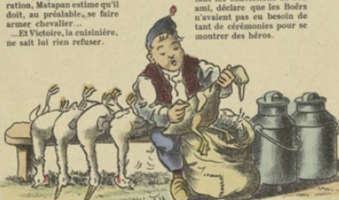
Après quoi, avisant un petit valet de ferme qui plume des volailles à côté de ses bidons de lait, ils l'abordent furtivement par derrière, et lui vident un plein bidon sur le corps... Le coup fait, et comme il est tout englué, ils l'enfouissent dans le sac aux plumes... les plumes s'attachent et font de la victime, quand elle est délivrée, le plus drôle d'oiseau du monde!