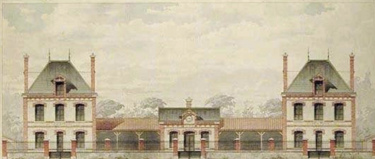
Plan de l'École Garçons