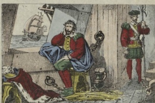
INGRATITUDE. — Après avoir gouverné sagement le Nouveau-Monde pendant quelques années, Christophe Colomb, tombé en disgrâce, est indignement renvoyé en Espagne chargé de fers.

Imp. Lith. PINOT & SAGAIRE, Edt rs à Epinal.