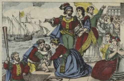
DÉPART. — Christophe Colomb part à la découverte du Nouveau-Monde avec trois vaisseaux équipés par la cour d'Espagne.