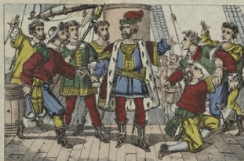
RÉVOLTE. — Les marins des équipages refusent d'avancer sur ces mers inconnues, ils veulent forcer Christophe Colomb à retourner vers l'Espagne.