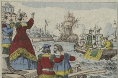
Christophe Colomb retourne avec une nouvelle flotte au Nouveau-Monde en qualité de vice-roi.

Imp. Lith. PINOT & SAGAIRE, Edt rs à Epinal.