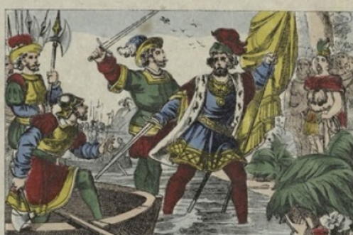
ARRIVÉE. — Après avoir dompté plusieurs révoltes en naviguant toujours, on découvre enfin le Nouveau-Monde, dont Christophe Colomb prend possession au nom de la reine d'Espagne.