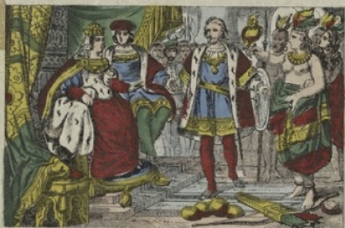
RETOUR. — Christophe Colomb revient en Espagne avec ses vaisseaux chargés d'or, de produits du Nouveau-Monde et d'immenses richesses.