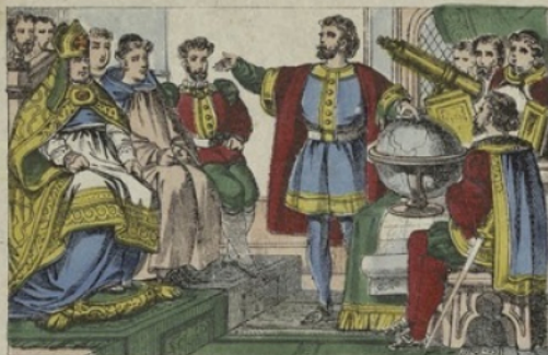
Le génois Christophe Colomb, savant marin, expose devant le grand conseil d'Espagne ses plans pour la découverte d'un Nouveau-Monde.