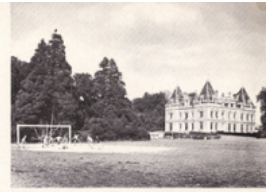
Le Château des Bergeries et les jeux de plein air.