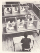
Travaux pratiques de langues vivantes.