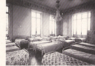
Dortoirs spacieux, hauts de plafond, très ensoleillés.