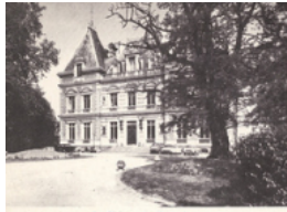
Le Château des Bergeries.