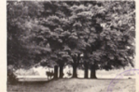
Enfants dans le parc de l'Internat.