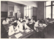
Salle de classes largement aérée.