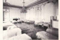
Dortoirs spacieux, hauts de plafond, très ensoleillés.