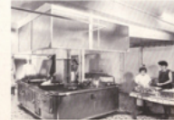
Les cuisines modernes.