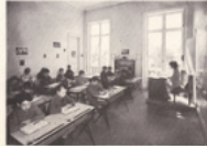
Salle de classes donnant sur la forêt de Sénart.