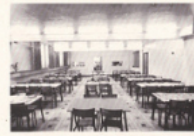
Vue des salles à manger.

L'enfant y reçoit ainsi un enseignement personnalisé et paisible dans une ambiance demeurée familiale, le réconfort dont il a besoin pour s'élever moralement et intellectuellement.