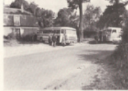
Les lieux avec la famille sont maternels (services réguliers par nos autocars).