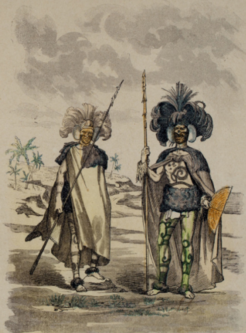
GUERRIERS DES ILES MARQUISES