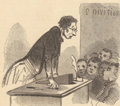
Messieurs, c'est dans quinze jours la fête de votre maître. — C'est cinq francs.