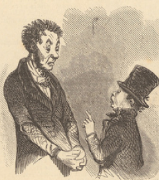
— Eh quoi! encore deux jours de congé! — Oui, papa. Ça ne fait que doute dans le mois.