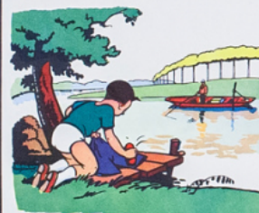
ré mi à la ri vi è re la ve la cu lo ite