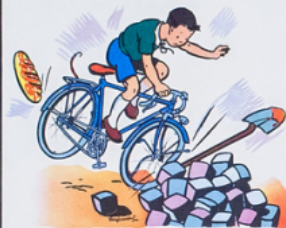
ré mi n'a pas vu le tas de pa vés