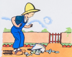
ré mi ca sse sa ta sse