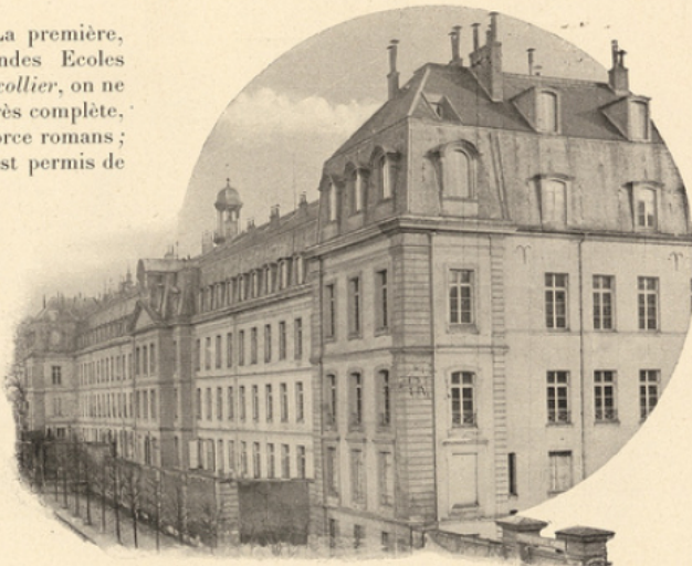
Vue Générale de l'Ecole.

La bibliothèque est, avec le parc, un des endroits de l'Ecole que l'on se rappelle avec le plus de plaisir. C'est une grande pièce silencieuse, laquée de gris clair et tout entourée de hautes vitrines que remplissent d'innombrables volumes. Au fond, sur un trumeau, le profil de Louis XV érige sa boudoirie majestueuse. Il y en avait, autrefois, plusieurs de ces profils, aux murs de la vieille maison. Il y avait aussi celui, plus agréable, de Mme de Pompadour. Dans sa belle rage patriotique de voir une porcelaine française triompher des bibelots importés de Saxe, la marquise s'occupait et se préoccupait fort de cette manufacture créée à son instigation et transportée en 1756 de Vincennes à Sèvres, dans l'ancien château du Florentin. Elle y venait souvent en promenade, se faisait montrer les fines pâtes dont les couleurs tendres, récemment inventées, portaient son nom. Et tout