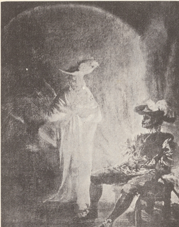
Goya : Don Juan et le Commandeur . Collection de Osuna.